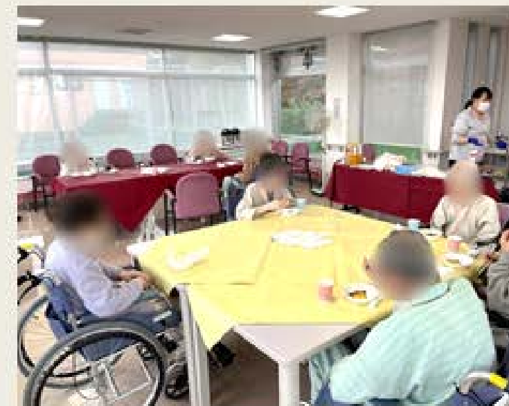
昨年実績の写真です。

コロナ対策に努めながら、ご面会頂けるよう配慮しております。ご家族様のご予約を心よりお待ちしております