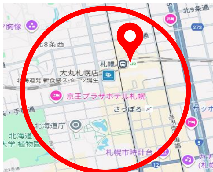
○印の辺りをドライブいたします。