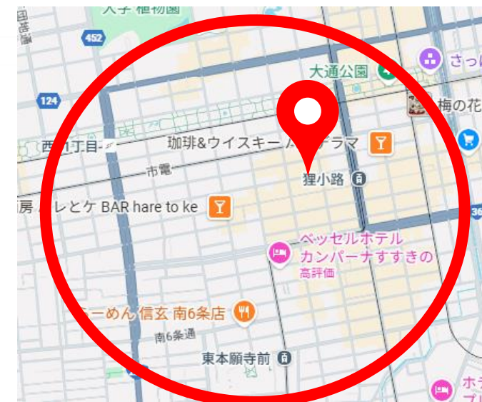
○印の辺りをドライブいたします。